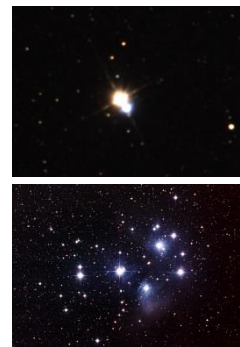
二重星アルビレオ（上） すばる（下）