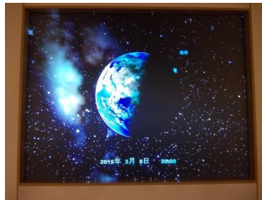
学校の要望に応えた内容で解説