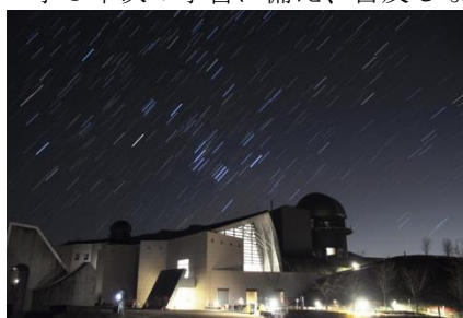
1時間あれば、星が動いたことが確認できる