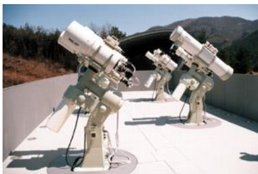
観望棟 観察用望遠鏡（計6台）