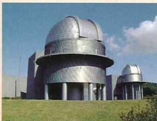
ぐんま天文台ドーム

・コースの表示時間はおよその目安です。道路事情により遅れることもございます。 ・申込人数が少ない場合はコースを中止する場合があります。また、荒天時はコースの内容を変更する場合があります。 ・お客様のご利用する駅の発着時刻は時刻表でご確認ください。